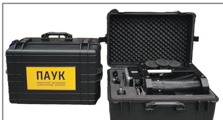
Изделие в кейсе с аксессуарами